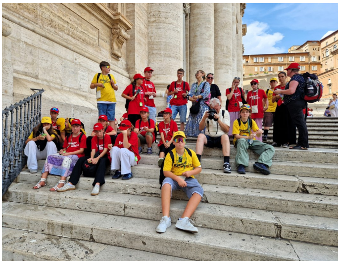
Foto vor dem Eingang in die größte Kirche der Welt, dem Petersdom