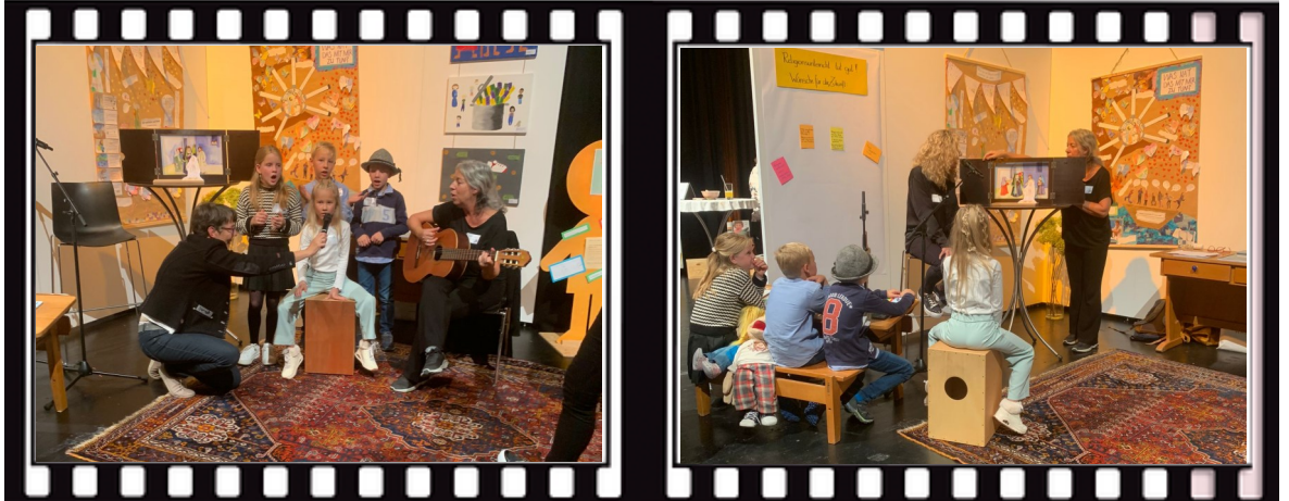
Rahmen von Alexandra_Koch auf Pixabay / Bilder privat

Unter dem Motto „tut gut“ traten die Kinder mit musikalischen und szenischen Beiträgen auf, die sie in den Wochen zuvor im Religionsunterricht einstudiert hatten. Mit strahlenden Gesichtern und